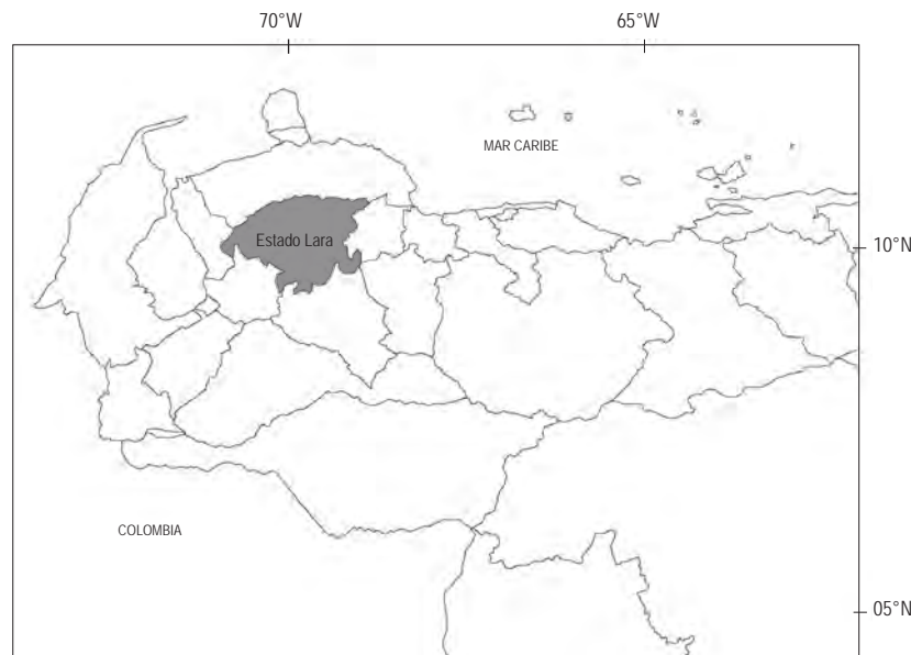
Figura 1. Ubicación político-administrativa del estado Lara con los límites de los estados.

entre las zonas montañosas andinas, la cuenca del Lago de Maracaibo, el sistema orográfico de Falcón y el surco depresional que relaciona los llanos con el mar Caribe (Strebin y Pérez 1982).