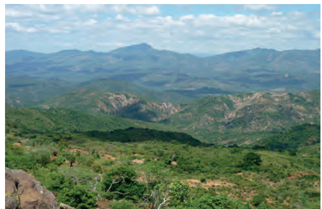
Figura 3. Vista panorámica de la sierra de Baragua, municipio Urdaneta, estado Lara, Venezuela.

En el Herbario José Antonio Casadiego (UCOB), se encuentra resguardado el testimonio de la gran riqueza florística de angiospermas presentes en el estado Lara. Las colecciones en él depositadas permiten evidenciar que existe un fuerte sesgo a favor de los municipios Morán, Palavecino e Iribarren, los cuales han sido intensamente explorados, mientras que municipios como Jiménez y Torres han sido pobremente explorados botánicamente, posiblemente por presentar áreas remotas de difícil acceso y en muchos casos por desconocimiento de las mismas.