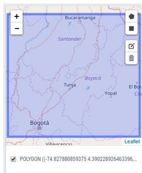
Figura 1. Consulta B por polígono en el Portal de Datos de GBIF, antes de ser refinada en Q-GIS.

Se realizó una segunda consulta considerando únicamente coordenadas geográficas. Este filtro se realizó sobre los datos con coordenadas, utilizando un polígono (rectángulo conformado por coordenadas decimales y almacenado en formato WKT) que se aproxima a la ubicación del departamento (Fig 1). Con esta consulta gruesa se identificaron y descargaron 663,154 datos asociados al departamento de Boyacá. Los datos resultantes fueron refinados en Quantum GIS, realizando un cruce de estos datos con un polígono detallado del departamento de Boyacá en escala 1:25,000, identificando 138,030 datos exclusivos para el área del departamento.