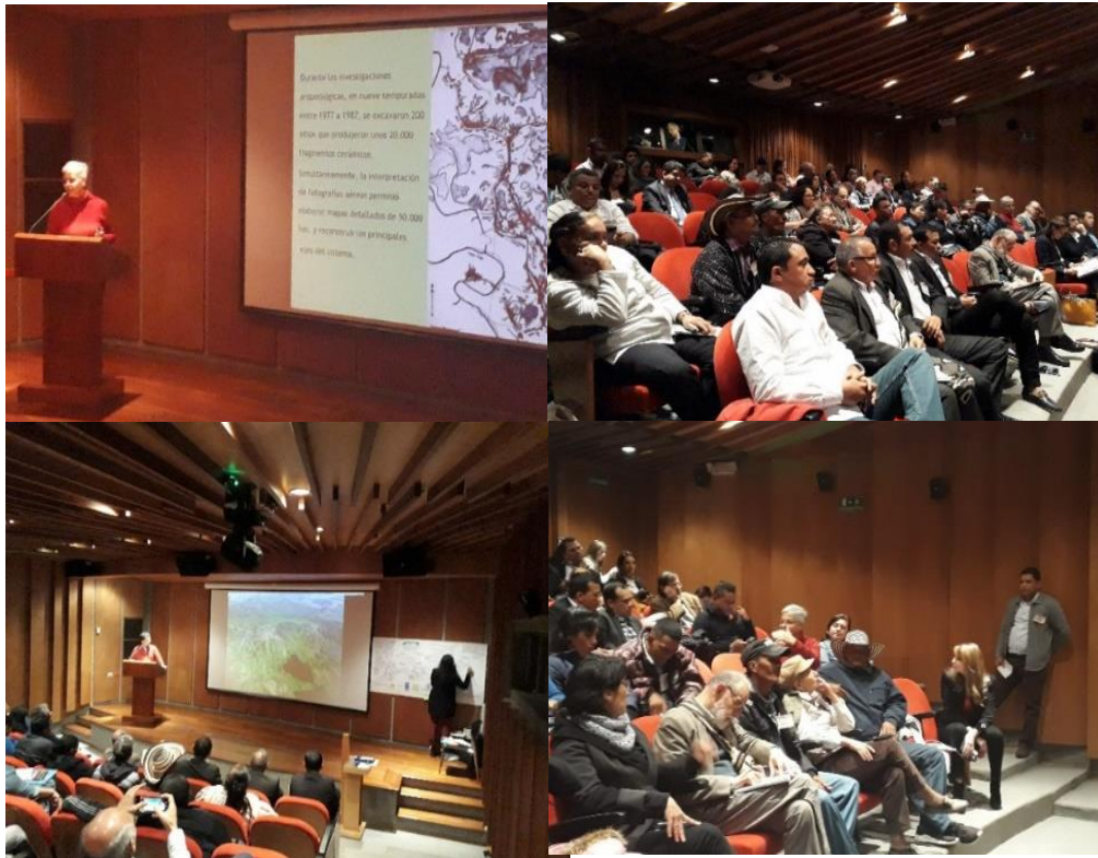
Figura 17. “Mojana, la tierra prometida, visita a Bogotá” en el Museo del Oro. A través de las conferencias se explicaron las diferentes razones sociales, hidrológicas, económicas, antropológicas, etc. que hacen de La Mojana un territorio anfibia en el que ocurren de manera natural los ciclos de sequía e inundación, a los cuales sus comunidades se han adaptado durante siglos, proveyéndose bienestar y calidad de vida; así como las causas (mal uso de los suelos, ganadería extensiva, construcción de diques, etc.) que la afectan y la hacen vulnerable a la variabilidad climática.