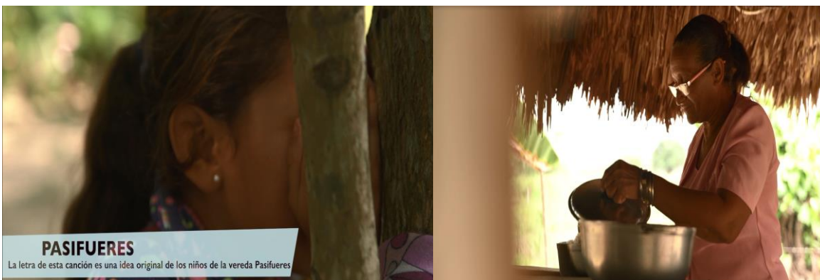
Figura 15. Imágenes videoclip Pasifueres. Texto que lo identifica: Pasifueres es una de las veredas de San Benito Abad, en La Mojana sucreña y es la protagonista de la canción y el video, un relato sobre la añoranza que siente una mujer por el lugar en donde nació y creció y del que tuvo que salir después de que las intensas inundaciones de 2010 acabaran con la biodiversidad, dejando pocas opciones de subsistencia. Pasifueres nació en un taller de apropiación social en el que participaron los niños y las niñas que allí viven. Ellos, junto a sus familias, nos contaron que en sus zapales, caños, ríos, playones y ciénagas, juegan a las escondidas; que la iguana, la hicoitea o el chavarrí, son animales mojaneros; que las altamisas, el campano o el higo son parte de la vegetación; y que entre las comidas tradicionales que más disfrutan están el guiso de hicoitea o el tamal de cerdo. Protagonizado por habitantes de esta y otras veredas cercanas, es un recorrido por parte de parte de este territorio anfibio, heredero del pueblo zenú que por más de dos siglos lo habitó, adaptándose a los tiempos de sequía e inundación. Así, obtuvieron abundancia de comida y recursos naturales”. Link a video: https://bit.ly/2L1fzVs