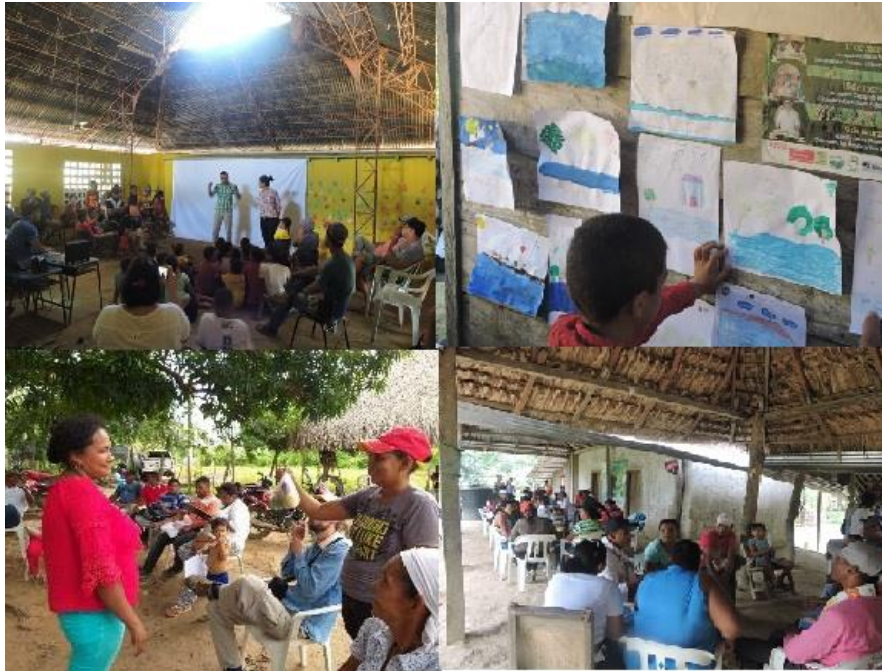
Figura 24. Divulgación de videos y talleres de apropiación de la rehabilitación y modos de vida mojaneros Momento 3. Reflexiones finales. En este momento, el equipo del Instituto Humboldt explicó, a partir de los videos, la estrecha relación entre los modos de vida mojaneros y la restauración y las diferentes formas en las que inciden en toda la región como medidas para reducir el riesgo y la vulnerabilidad de las comunidades frente al cambio climático; y, por eso, la necesidad de conducir todos los esfuerzos hacia la sostenibilidad de la restauración, lo cual implica que las comunidades se reconozcan como corresponsables en la gestión de sus territorios. Los participantes en los talleres, generaron reflexiones frente a la necesidad de fortalecer capacidades conjuntas (trueque de semillas de especies forestales para la restauración, red de contactos para compartir experiencias y generar soluciones frente al establecimiento de huertas, por ejemplo) que les permitan el aprovechamiento sostenible de los servicios que les brindan los humedales y, por lo tanto, el cuidado de la restauración.