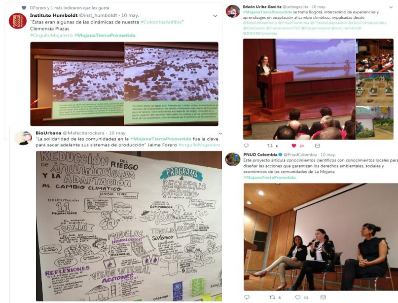
Figura 18. Registro de “Mojana, la tierra prometida, visita a Bogotá” en redes sociales del Instituto Humboldt, PNUD y a través de perfiles de algunos usuarios de las mismas.