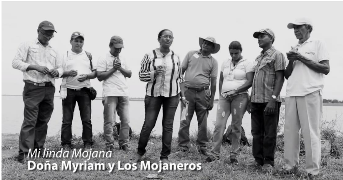
Figura 1. Escena del videoclip Mi linda Mojana . Los integrantes del grupo protagonizaron el video en el que interpretan la canción compuesta por todos; en la escena se observan promotores ambientales de diferentes comunidades de La Mojana.