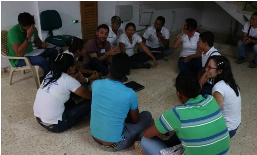
Figura 2. Grupo radio, creadores de La luz ambulante , mientras escuchan las indicaciones sobre cómo hacer el libreto (relato) para la radionovela.