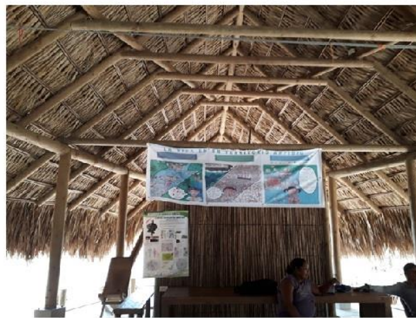
Figura 5. Pancarta/mural de La Mojana en tres escenas. El dibujo inicial fue intervenido en diseño gráfico para ubicar elementos como logos institucionales de las entidades financiadoras e implementadoras del proyecto y textos explicativos sobre cómo se creó la historieta, y para darle las características técnicas necesarias para su impresión (tamaño, resaltar colores, formato digital para impresión, etc.). La historieta así se convirtió en un producto de divulgación del Proyecto creado por las comunidades, para las comunidades. En la imagen se ve la pancarta ubicada en el Centro Comunitario de El Torno.