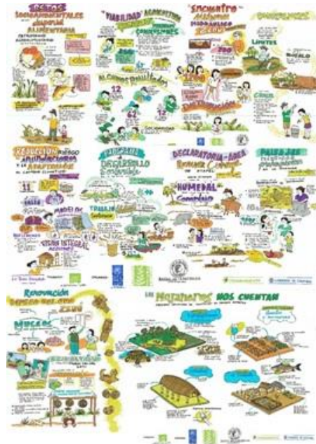
Figura 19. Documentación gráfica de “Mojana, la tierra prometida, visita a Bogotá”, que muestra las ideas claves de las conferencias, el recorrido por la colección zenú del Museo del Oro y el espacio de intercambio de experiencias en el que los promotores ambientales del Proyecto PNUD presentaron las iniciativas de arquitectura, sistemas agrosilvopastoriles y huertas para la adaptación al cambio climático, que se adelantaron en sus comunidades (espacio organizado por PNUD).