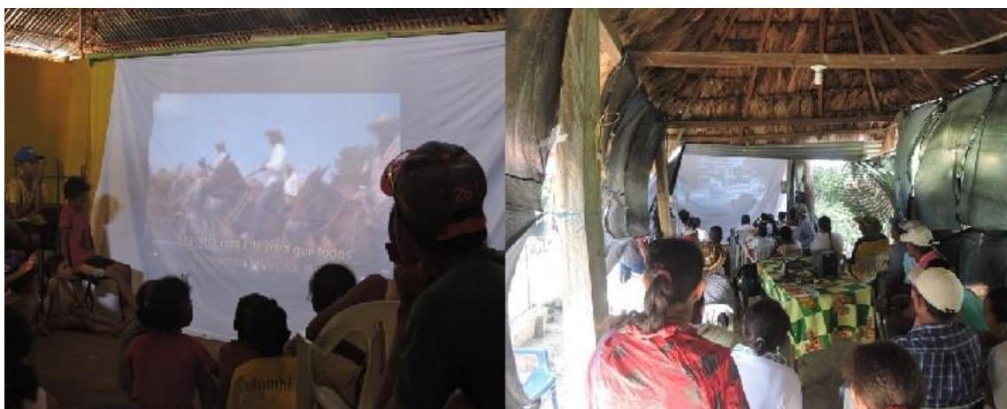
Figura 23. Divulgación de videos y talleres de apropiación de la rehabilitación y modos de vida mojaneros Momento 2. Presentación de los videos; en las fotos, comunidades de Seheve (izquierda) y Pasifueres (derecha).