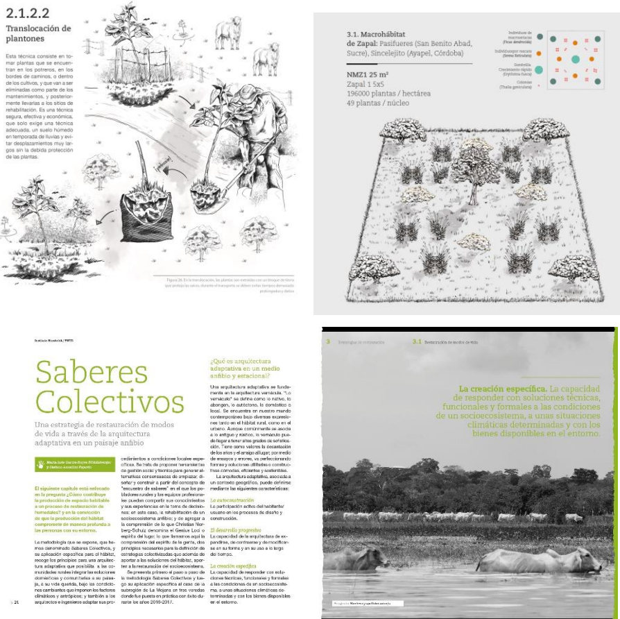
Figura 31. Propuestas de diseño y diagramación del “Protocolo de restauración de humedales en tierras bajas del norte de Colombia” (título tentativo).

Es la publicación que se genera a partir de las metodologías y experiencias generadas en el Proyecto PNUD para la reducción del riesgo y la vulnerabilidad de las comunidades de La Mojana frente al cambio climático (Figura 31). La misma busca dar soporte conceptual, técnico y operativo a los proyectos de restauración de humedales en tierras bajas Colombia. Al cierre del convenio 16-075, la publicación se encuentra en proceso de diseño y diagramación y se publicará durante el primer semestre de 2019.