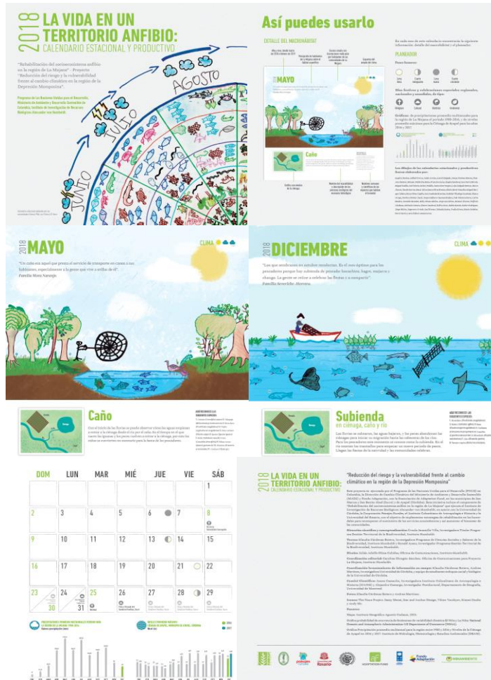
Figura 30. Calendario ecológico estacional 2018. Los mapas elaborados por las comunidades en las actividades de percepción de los servicios ecosistémicos, fueron los principales insumos para diseñar el calendario ecológico estacional: las escenas de cada macrohábitat son los dibujos que hicieron y las especies vegetales y de fauna son las que identificaron; los demás datos (descripción de cada macro hábitat, temporada de lluvias y sequías) fueron proporcionados por el equipo técnico del Proyecto; y el diseño y diagramación estuvo a cargo de la Oficina de Comunicaciones del Instituto Humboldt. Los calendarios impresos se entregaron a las comunidades a través de los promotores ambientales y a entidades relacionadas con el Proyecto