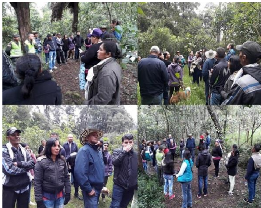
Figura 20. Recorrido por la restauración de los Cerros Orientales. Durante el mismo, los promotores ambientales conocieron las especies forestales con las que se está llevando a cabo la restauración ecológica, así como las causas de degradación del bosque altoandino en esta zona de Bogotá, sus consecuencias para el ecosistema, y, especialmente, los beneficios que la restauración traerá

son los principales desafíos de las comunidades frente a sus procesos de organización y asociación para la autogestión de sus territorios, fueron algunos de los temas que se trataron.