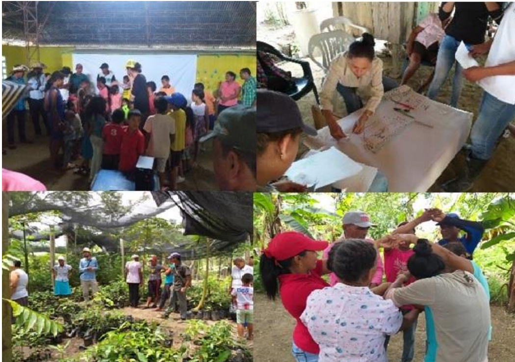
Figura 22. Divulgación de videos y talleres de apropiación de la rehabilitación y modos de vida mojaneros Momento 1. A través de diferentes actividades (juego de roles, cadena de asociaciones) se propició la integración de los participantes en el taller, teniendo en cuenta que provenían de diferentes comunidades (veredas) y que muchos no se conocían entre ellos. En este momento, las actividades generaron interrogantes frente al trabajo en equipo, el reconocimiento del otro, sus necesidades y expectativas, o la necesidad del diálogo y la mediación como rutas para llegar a acuerdos comunes que propicien la sostenibilidad del proceso de restauración.