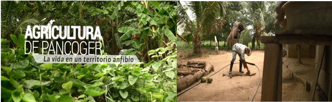
Figura 14. Imágenes video Agricultura de pancoger. Texto que lo identifica: “En La Mojana, las familias destinan espacios como patios, huertas, parcelas o solares a diferentes cultivos, conectadas con los humedales de la región. De ríos, caños y ciénagas, por ejemplo, obtienen arroz criollo, maíz, yuca o plátano; son alimentos que, tras su cosecha, guardan en tambos en donde se conservan para su consumo en tiempos de escasez. En La Mojana, la actividad productiva está determinada por los suelos, las lluvias, la dinámica fluvial o la temperatura. Son eventos que, aunque los campesinos conocen con precisión y que les ha permitido saber qué cultivar y en qué época, han variado en los últimos años debido a los efectos del cambio climático. En esta historia, Francisco Manuel Luna, nos cuenta cómo realiza las labores de pancoger en su finca ubicada en El Chinchorro, San Benito Abad, Sucre, y cómo vive, junto a su familia, en esta región de humedales”. Link a video: https://bit.ly/2UmVLQj