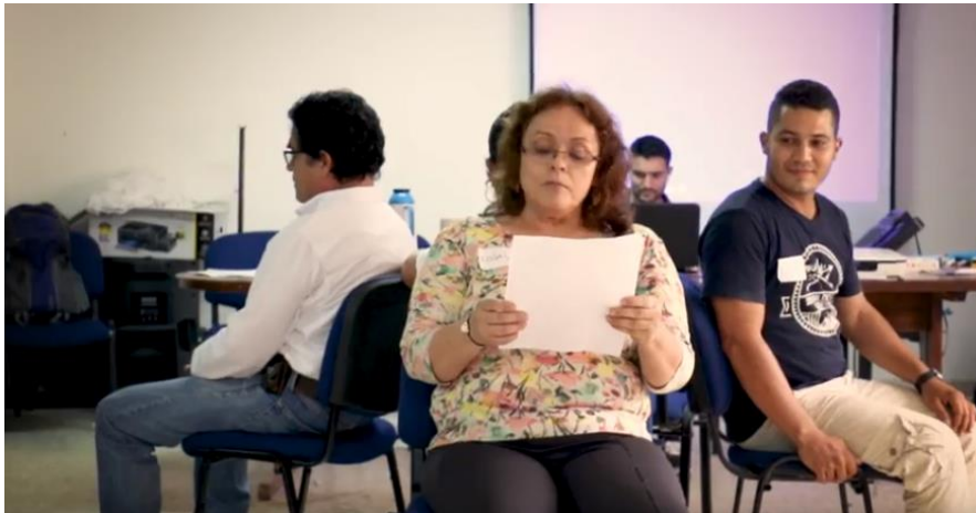
Figura 3. Integrantes del grupo cuento ¡Ay, viene ya!, al momento de representar su narración ante los demás participantes del taller, siendo, la puesta en escena la forma de transmitir el relato, diferente al video o la radionovela, aunque de todas las actividades quedó registro audiovisual.