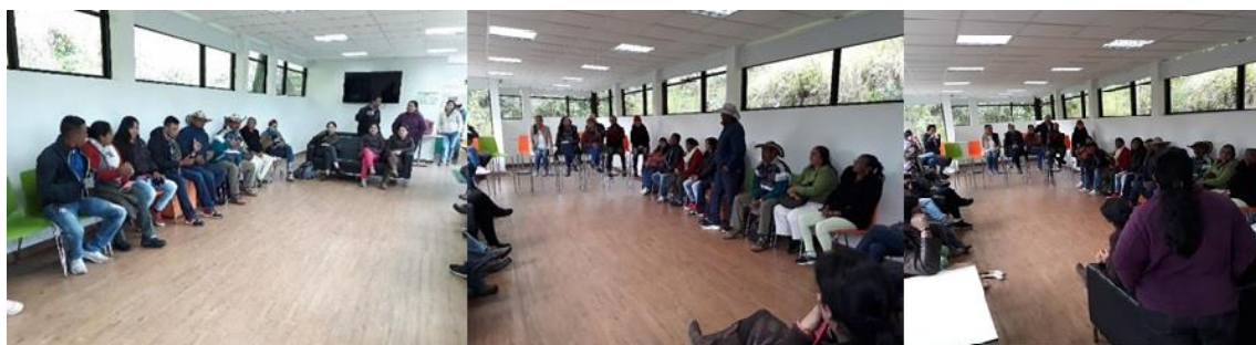
Figura 21. Intercambio de experiencias en el Instituto Humboldt. Los investigadores del Instituto tuvieron la oportunidad de escuchar a los promotores ambientales, quienes compartieron sus experiencias sobre cómo ha se han dado las diferentes intervenciones en el marco del Proyecto de Reducción del riesgo y de la vulnerabilidad frente al cambio climático en La Mojana.