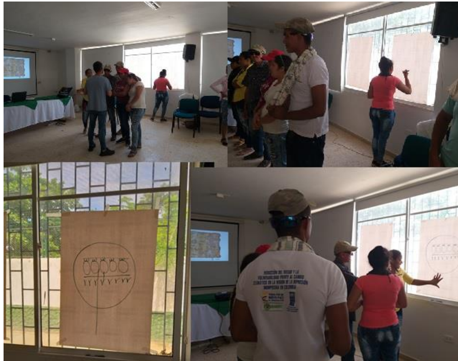
Figura 28. Actividad el dibujo oculto. En el dibujo oculto, por equipos, los integrantes debían asignar a un dibujante que no sabía lo que debía dibujar (un árbol, una casa, etc.), mientras que el equipo, de espaldas a su representante, no sabía lo que este estaba dibujando de acuerdo a las instrucciones (sencillas y puntuales) que le daban: pinta una raya, has un círculo, dibuja un cuadrado grande y cuatro pequeños, por ejemplo. No estaba permitida la comunicación entre representante y equipo. Al descubrir el dibujo logrado, se encontró que, excepto unos pocos, no correspondían al objeto (el árbol, la casa). La actividad evidenció las consecuencias de la falta de comunicación o una comunicación deficiente en las comunidades (vecinos, líderes-habitantes, asociaciones-habitantes, etc.) especialmente en espacios o dinámicas que requieren de la capacidad de asociación y trabajo conjunto de las comunidades.