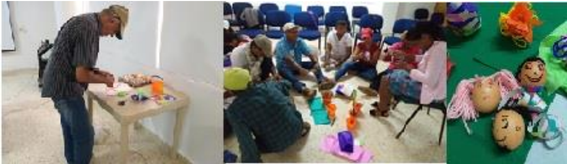
Figura 26 Actividad punto de quiebre. Al iniciar el taller, cada uno de los participantes decoró la cáscara de un huevo a su gusto con los materiales dispuestos por el equipo de Comunicaciones del Instituto Humboldt: marcadores, lanas, cintas de colores, etc. El huevo representó el regalo máspreciado que ese día, cada uno de los participantes llevaría a su hogar; por lo mismo, la decoración también implicaba crear un “escudo protector” para proteger ese regalo, pero con pocos materiales (cinta, lápices y papel). Posteriormente, después de desarrollar otras actividades, el tallerista puso a prueba esos escudos al lanzar sobre el piso, algunos de los huevos decorados: algunos superaron la prueba y otros se destruyeron. Al preguntar a los dueños de los huevos que se rompieron el por qué no hicieron un mejor escudo protector, las respuestas fueron “me quedé sin materiales y no pedí a mis compañeros que me compartieran algunos de ellos”, “no le presté atención a las instrucciones” o “creí que con solo cubriéndolo con un poco de papel resistiría” (puntos de quiebre). El espacio de reflexión frente a temas de autogestión, corresponsabilidad, empoderamiento y liderazgo se generó cuando se dijo a los participantes que el huevo representaba la restauración y los materiales las capacidades técnicas que el Proyecto de Reducción del riesgo y de la vulnerabilidad frente al cambio climático ha reforzado en las diferentes iniciativas.