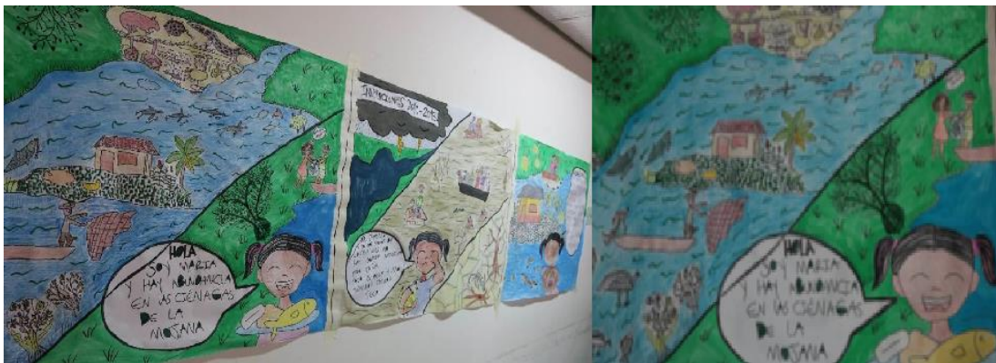
Figura 4. Dibujo original de La Mojana en tres escenas, que se exhibió a los demás participantes en el taller de cocreación.

A diferencia de las anteriores actividades, cuyos resultados (videos) sirvieron como herramienta de divulgación del proyecto de rehabilitación a través de redes sociales del Instituto Humboldt (caracterizadas por el carácter universal de su público, edades, regiones, etc., pero consumidores de información sobre biodiversidad), la historieta fue el primer producto de divulgación del proyecto, dirigido a las comunidades en donde se realizó la intervención pues esta se imprimió a manera de pancarta/mural que se exhibió en lugares como centros comunitarios o viveros (Figura 5).