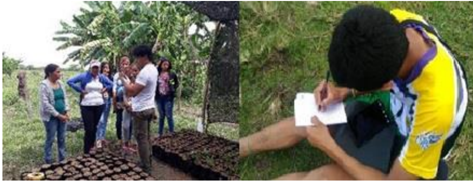
Figura 25. Taller reporteros de los humedales. Este taller se realizó como piloto de lo que podría ser un ejercicio de comunicación comunitaria a partir del uso de celulares inteligentes y tablets, los cuales ofrecen la posibilidad de crear contenidos a partir de fotografía, video, audio o texto; dichos contenidos se enfocarían en la cotidianidad del proceso de restauración, la cual sería contada por los “reporteros de los humedales” a las comunidades a través de aplicaciones como WhatsApp. Así, se potenciaría el sentido de pertenencia al territorio anfibio y, por lo tanto, a los procesos de restauración que allí se adelantaban.