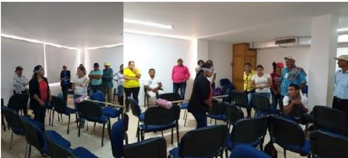
Figura 27. Actividad del laberinto. En la actividad del laberinto, los participantes se dividieron en grupos, cada uno de los cuales debía superar los laberintos que los demás construyeron con los recursos que tenían a la mano; un líder por equipo dio instrucciones al compañero que con los ojos vendados debía cruzar el camino y superar los obstáculos, mientras que los demás integrantes debían guardar silencio. Las instrucciones se acordaron en equipo previamente. Así, se realizó una actividad de sensibilización frente al saber escuchar, a dar orientaciones claras y sencillas y al liderazgo.