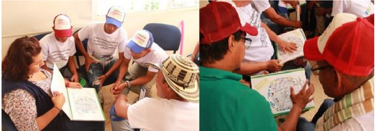
Figura 8. Rotafolios Taller de socialización. Los rotafolios se crearon con el fin de ofrecer a los promotores ambientales y coinvestigadores una herramienta de apropiación que les permitiera promover la importancia de los servicios ecosistémicos de los humedales de La Mojana y su estrecha relación con la sostenibilidad de la restauración y la recuperación de los modos de vida.

percepción de los servicios ecosistémicos realizados en cada comunidad, los cuales brindaron información sobre la ecología de zapales, caños, ríos y ciénagas; y los diferentes usos de los recursos naturales según las veredas y sus macrohábitats (Figura 9).