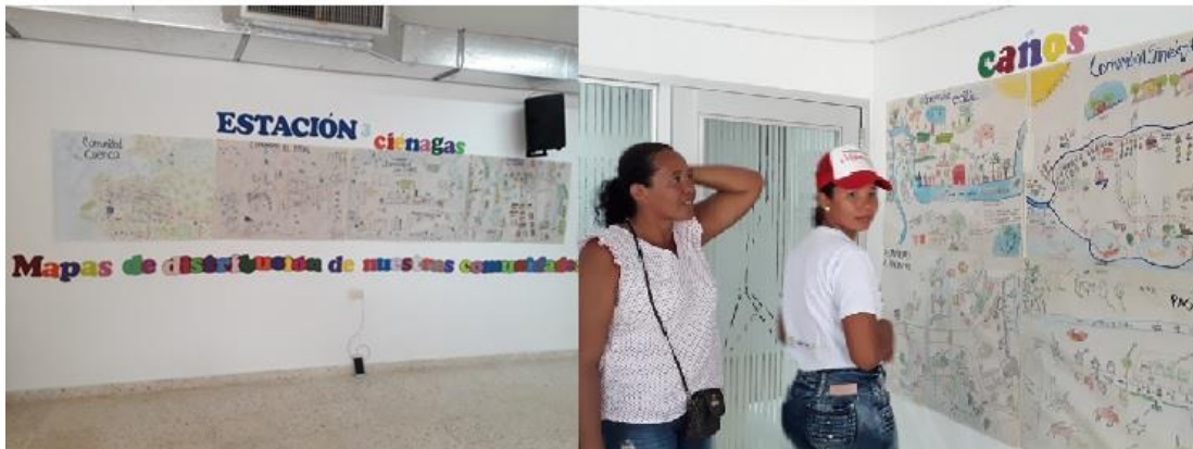
Figura 9. Socialización de insumos que resultaron de los talleres para identificar la percepción de los servicios ecosistémicos se realizó a manera de exhibición que recorrieron los promotores ambientales y demás asistentes al taller.