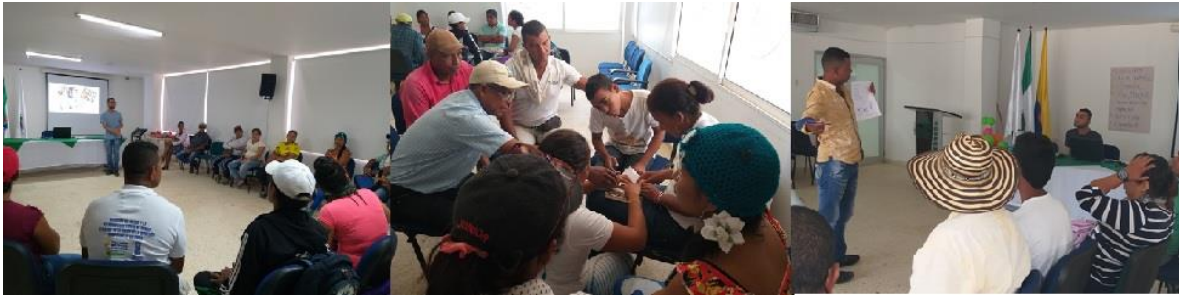
Figura 29. Juego de roles y simulación de escenarios. La actividad consistió en simular un proceso de asignación oficial de recursos económicos para inversión en aquellas acciones calificadas por las comunidades como prioritarias. Un Estado imaginario y su representante, estableció las acciones de inversión: vivienda, salud, medio ambiente, infraestructura, educación y agua potable. Los participantes se dividieron en tres grupos, cada uno de los cuales representó a una comunidad imaginaria que debía organizarse para solicitar dichos recursos según las necesidades de su territorio, caracterizado por circunstancias geográficas, sociales y económicas diferentes o no a los demás. La condición: las soluciones o iniciativas de intervención debían procurar el bienestar de las tres comunidades, como región. Tras un tiempo de deliberación por comunidades, el representante de cada comunidad hizo su solicitud al Estado quien, de acuerdo a los argumentos, la negaba, aprobaba completamente o con algunas condiciones. La actividad generó reflexiones frente a la capacidad de diálogo, mediación, llegar a acuerdos y resolución de conflictos y capacidad de asociación de las comunidades; y frente a la necesidad de conocer y comprender los territorios como herramienta de argumentación en procesos de intervención como el proyecto de restauración de humedales.