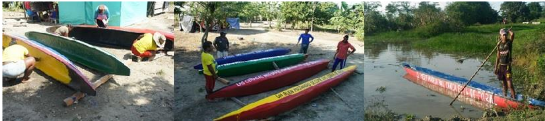
Figura 6. Reparación y embellecimiento de canoas. Momentos durante la recuperación y embellecimiento de las canoas. Para la actividad se dispuso de herramientas de carpintería y pinturas con las que los participantes arreglaron sus canoas.