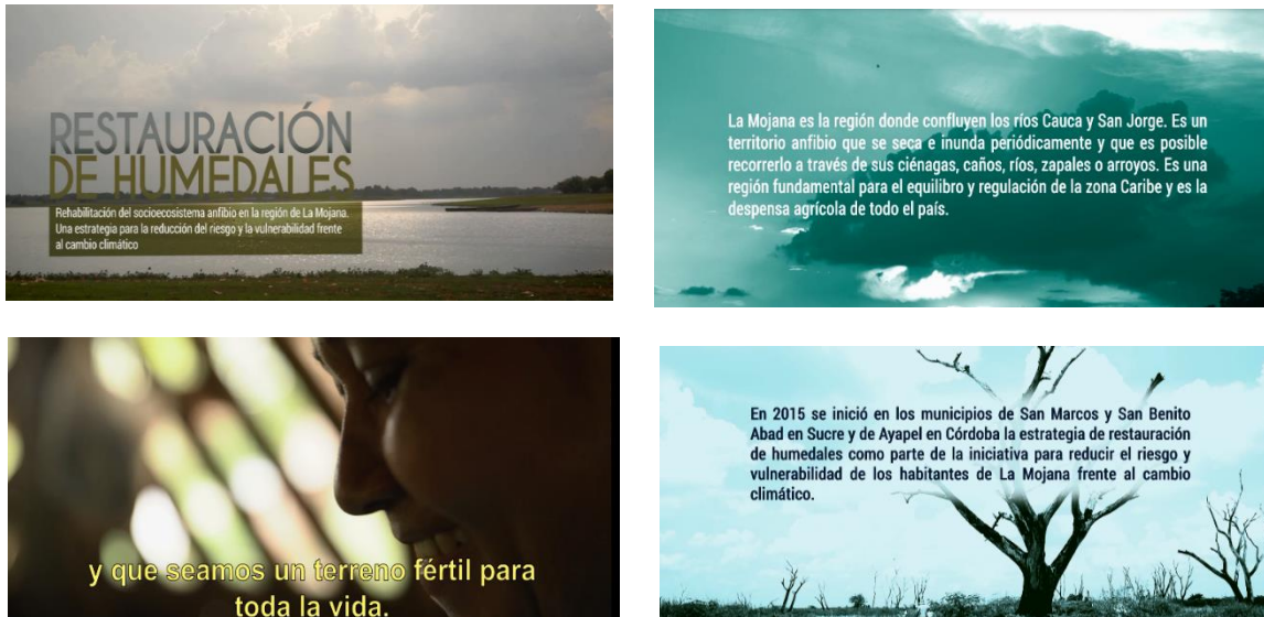
Figura 16. Imágenes del video que identifica al Proyecto de rehabilitación de humedales adelantado en La Mojana. Link a video: https://bit.ly/2AUPe6l