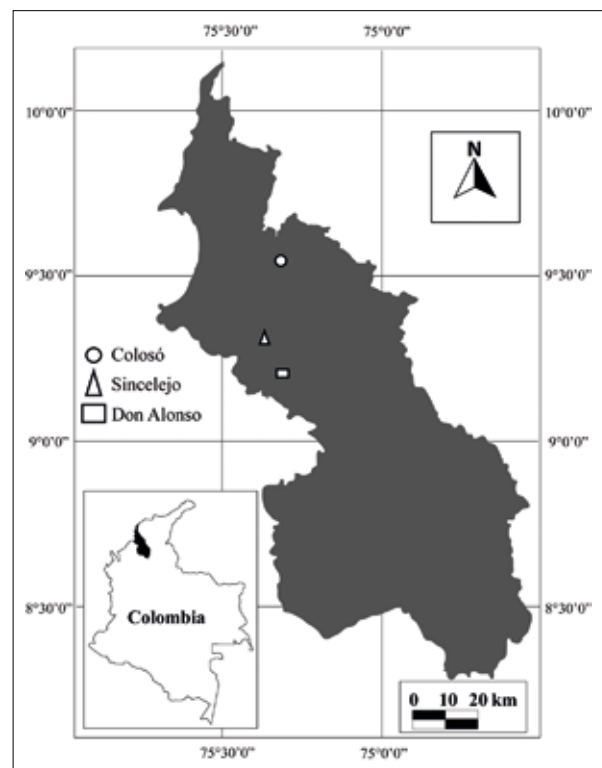
Figura 1. Localidades de colecta de Polistinae en el departamento de Sucre, Colombia.

El estudio se realizó en el departamento de Sucre, localizado en la planicie costera Caribe al norte de las cordilleras Central y Occidental, entre 10°09' y 08°17' N - 74°32' y 75°42' O, con una superficie de 10.364 km 2 . El clima es cálido y seco, con temperatura promedio de 27,5 °C, humedad relativa promedio del 77 % y precipitación anual de 1150 mm (Carsucre 2007). Se trabajó en tres áreas con diferente grado de intervención antrópica: relicto de bosque ubicado en las inmediaciones de la estación "Primates" del municipio de Colosó (09°31'58,02" N - 75°20'59,85" O); agroecosistema correspondiente a policultivos de yuca, ñame y maíz en el corregimiento de Don Alonso, municipio de Corozal (09°13'31,25" N - 75°20'19,60" O) y área urbana ubicada en el Campus de la Universidad de Sucre en el municipio de Sincelajo (09°18'53,15" N - 75°23'17,83" O) (Figura 1). Todas corresponden al Bosque Seco Tropical (Bs-T) según Holdridge (1979).