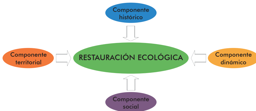
Figura 1. Componentes del marco conceptual de la Restauración Ecológica (McCook, 1994; Hobbs & Harris, 2001; SER, 2004, Temperton et ál. , 2004; Hobbs, 2002, 200; Young et ál. , 2005; Hobbs et ál. , 2006; Van Andel & Aronson, 2005; Barrera-Cataño et ál. , 2010).

Desde el componente dinámico entendemos que todos los sistemas ecológicos presentan diferentes niveles de resiliencia y tienden a mantenerse estables o en diferentes estados metaestables en el tiempo. Sin embargo, el desarrollo de los ecosistemas es un proceso activo, creativo y repetitivo –pero nunca en los mismos términos–, el cual es originado por los disturbios y por la sucesión ecológica (Odum, 1963; Margalef, 1974; Begon et ál. , 1996; McCook, 1994).