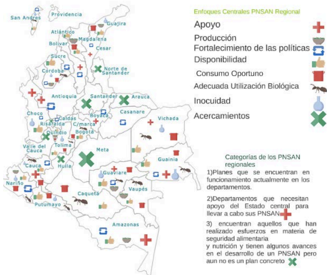
Gráfica 2: Mapa que relaciona los avances de los planes de seguridad alimentaria en las regiones con algunas categorías de análisis

El mapa describe los ejes centrales consignados en los Planes Nacionales de Seguridad Alimentaria (PNSAN) por departamento y se subraya el avance en su formulación e implementación 29 . Vale la pena mencionar que departamentos estratégicos como Boyacá, Vichada, Guaviare y Amazonas necesitan el apoyo para la implementación de su plan en SAN y otros como Meta, Arauca, Santander entre otros no tienen un avance significativo en su formulación. El mapa también permite darse una idea de los avances en la formulación de los ejes centrales de la política de SAN.