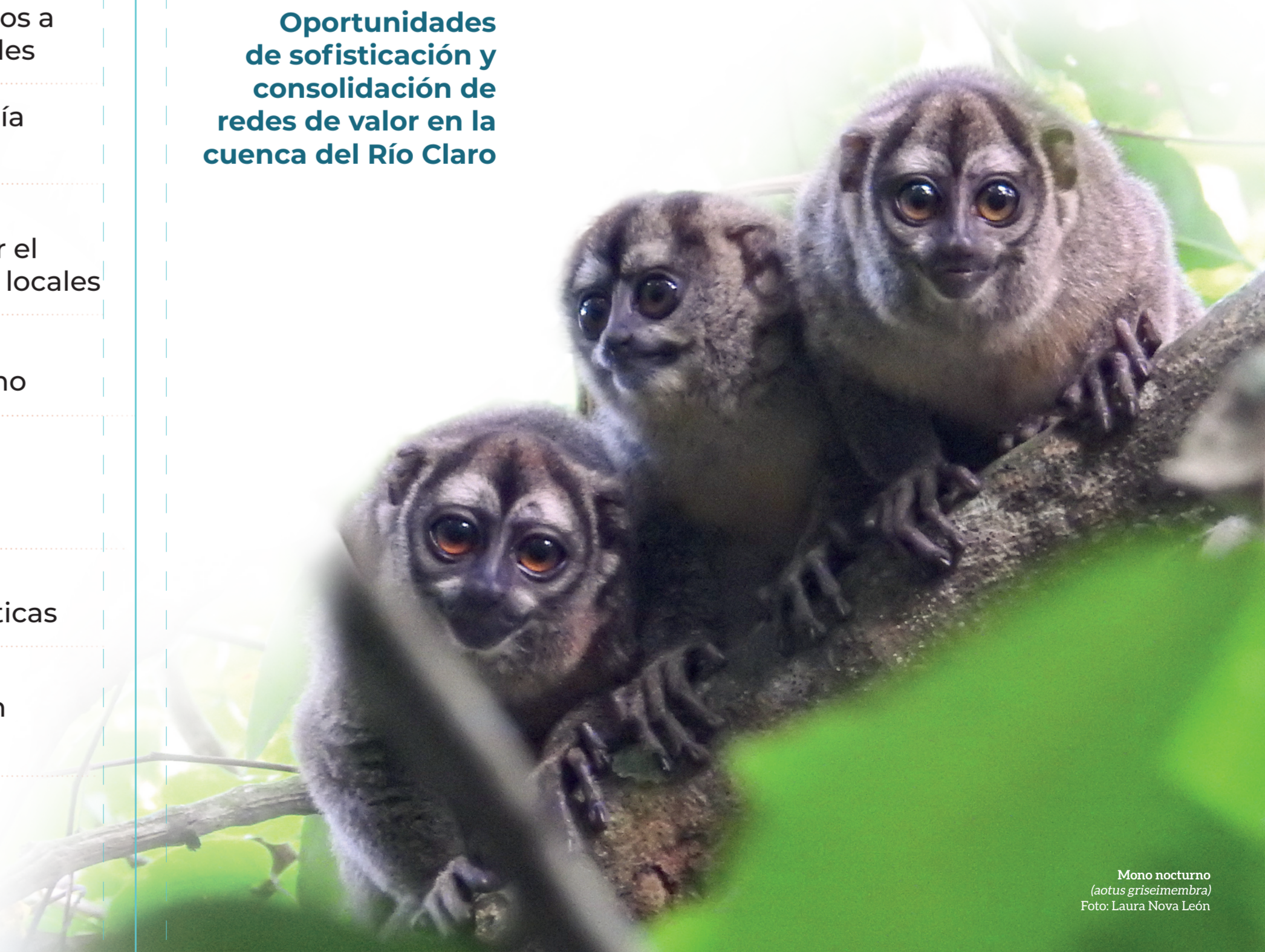
Mono nocturno (Aotus griseimembra)