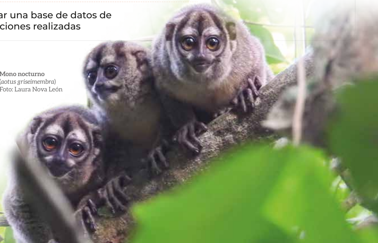
Mono nocturno ( aotus griseimembra )

ACTIVOS BIOCULTURALES Y ATRACTIVOS TURÍSTICOS